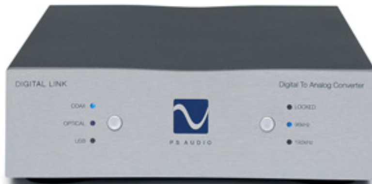
Die Wahl des Digitaleingangs kann per Taster oder automatisch erfolgen

Und schon sind wir bei der für PS-Audio-Entwickler Paul McGowan letztlich klangentscheidenden Stufe des DL III angekommen, in der die Ausgangsströme des PCM1798DB in Spannungen umgewandelt werden. Nach seiner festen Überzeugung ist der Einsatz von nicht ausreichend schnellen Operationsverstärkern für diese Aufgabe die Ursache des harten und überhellen „Digitalklanges“. PS Audio überträgt die Strom-Spannungs-Wandlung einem einzelnen Transistor, der ohne Gegenkopplung auskommen und daher von aus Geschwindigkeitsproblemen resultierenden Verzerrungen so gut wie frei